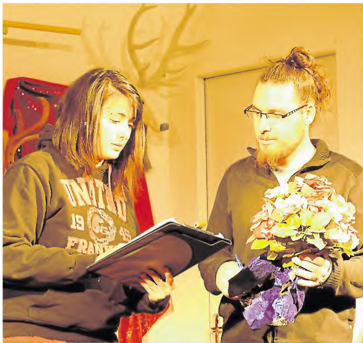
« La Maison à l'envers » a mobilisé les onze acteurs et actrices de L'Etincelle durant toute la saison hivernale.