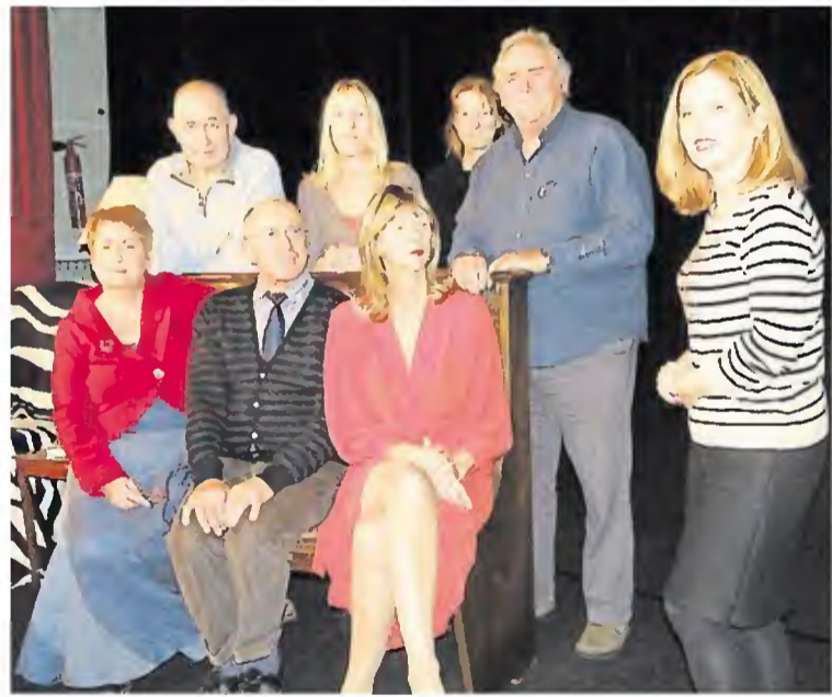
Une partie de la troupe, lors du précédent spectacle, en décembre à Vasles.

L'association Théâtre-Vasles présente sa nouvelle comédie, jouée en anglais, dans laquelle un match de cricket sert de prétexte à une intrigue entre joueurs et épouses. La pièce, « Outside Edge », écrite par Richard Harris, est présentée ce samedi, à 14 h 30. Les