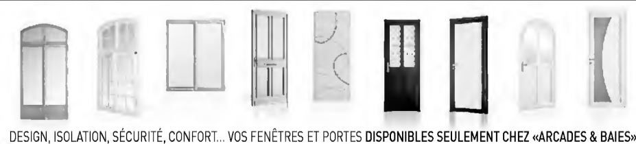
DESIGN, ISOLATION, SÉCURITÉ, CONFORT... VOS FENÊTRES ET PORTES DISPONIBLES SEULEMENT CHEZ «ARCADÉS & BAIÉS»

+ DE 600 MODÈLES DE PORTES D'ENTRÉE À DÉCOUVRIR